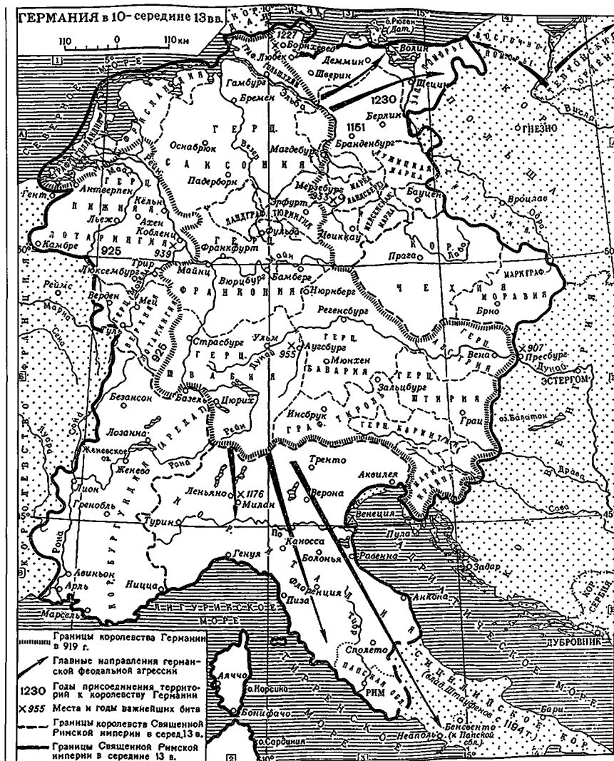
Экспансия Священной Римской империи германской нации в X–XIII вв. (карта из Большой Советской Энциклопедии)