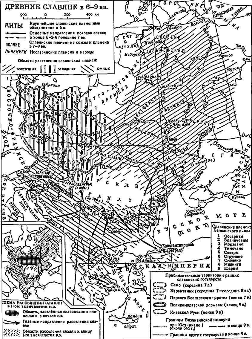
Расселение славян в Центральной и Восточной Европе в VI-IX вв. (карта из БСЭ)